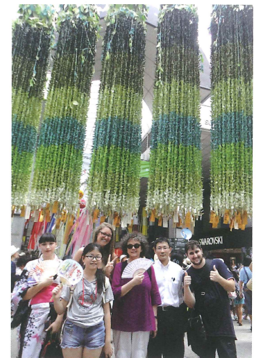
仙台市一番町商店街にて Sendai Ichibancho Arcade

8月 August — 仙台七夕 Sendai Tanabata festival