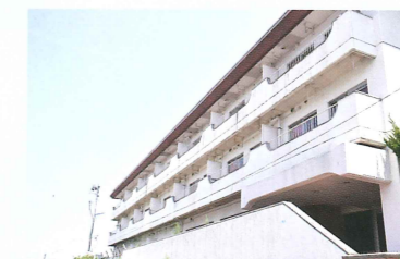
北山寮(収容定員100名)

The school has student dormitories. The rooms are ready and prepared for students to start out a new life from the day they arrive.