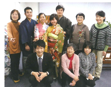
着物体験 Kimono dressing