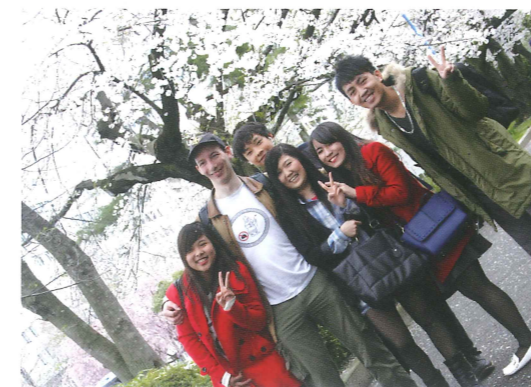
仙台市榴岡公園にて Sendai Tsutsujigaoka Park