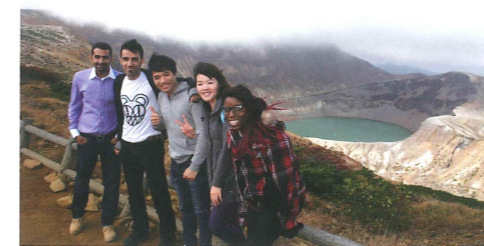
宮城蔵王お釜にて Miyagi Zao Okama Crater

2月 February — ボーリング大会 Bowling competition