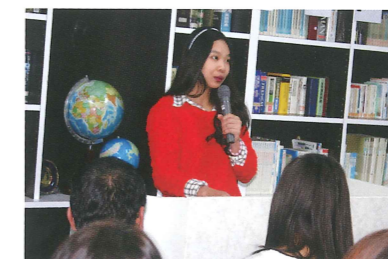
スピーチコンテスト Speech contest

10月 October — 専門学校オープンキャンパス Vocational school open campus